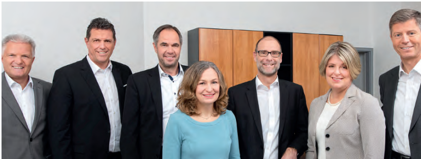
Die Mitarbeiter von Das Wertehaus

Das Wertehaus wird auch schon gerne und individuell für kleinere Stiftungen tätig. Erfahrung, Solidität und Kompetenz der Vermögensverwaltung stimmen.