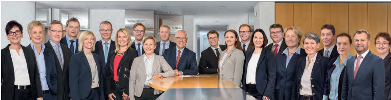
Das Team der Collegium Vermögensverwaltung

Diese unprätentiöse mittelständische Verwaltung mit ihrem klaren Leistungs- und Wertekompass passt zu vielen Stiftungen.